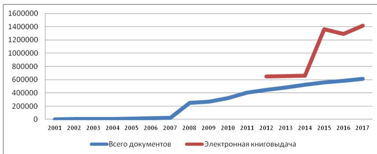
Рис.1 Рост ЭБ РНБ

Приоритетными с точки зрения вида материала для перевода в электронную форму являются рукописные и архивные документы, уникальные изобразительные материалы, первопечатные и раскрашенные вручную географические карты, редкие книги и другие печатные материалы.