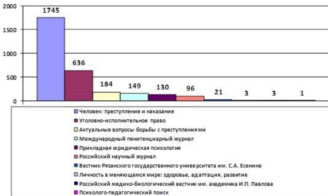
Рис. 2. Массив статей по юридическим наукам в рязанских журналах, индексируемых в РИНЦ (2000–2018 гг.)

каковы доли отдельных журналов в массивах статей по этим отраслям знания. Доли представлены на диаграммах на рис. 2-8.