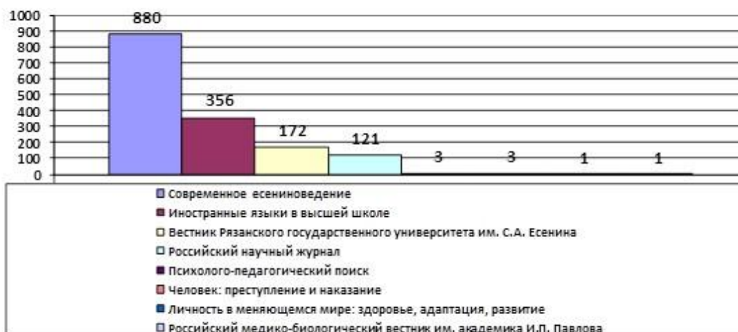
Рис. 5. Массив статей по филологии в рязанских журналах, индексируемых в РИНЦ (2000–2018 гг.)