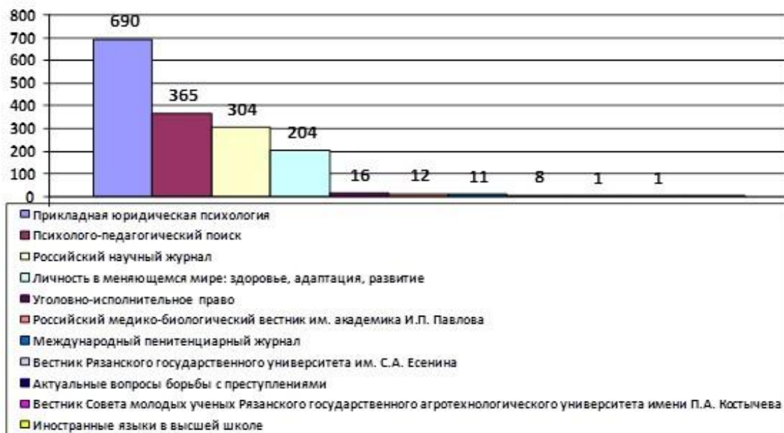
Рис. 3. Массив статей по психологии в рязанских журналах, индексируемых в РИНЦ (2000–2018 гг.)