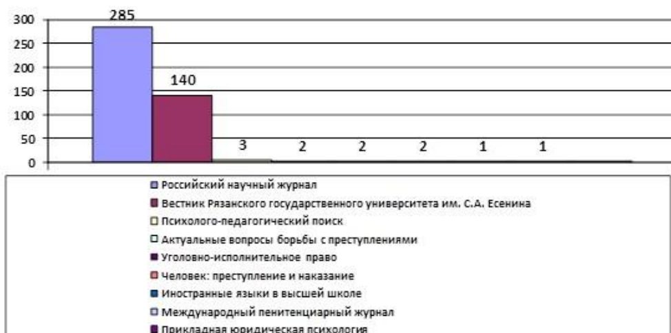
Рис. 6. Массив статей по истории в рязанских журналах, индексируемых в РИНЦ (2000–2018 гг.)