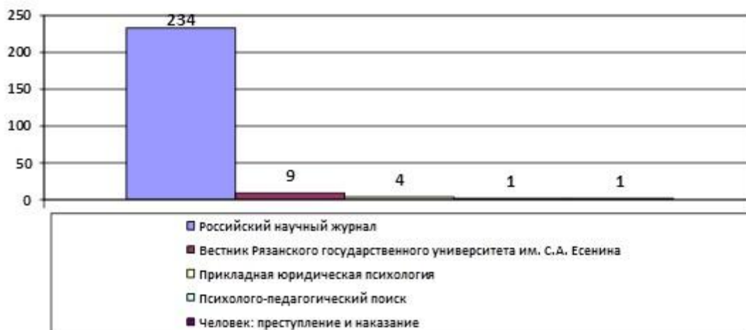
Рис. 8. Массив статей по социологии в рязанских журналах, индексируемых в РИНЦ (2000–2018 гг.)