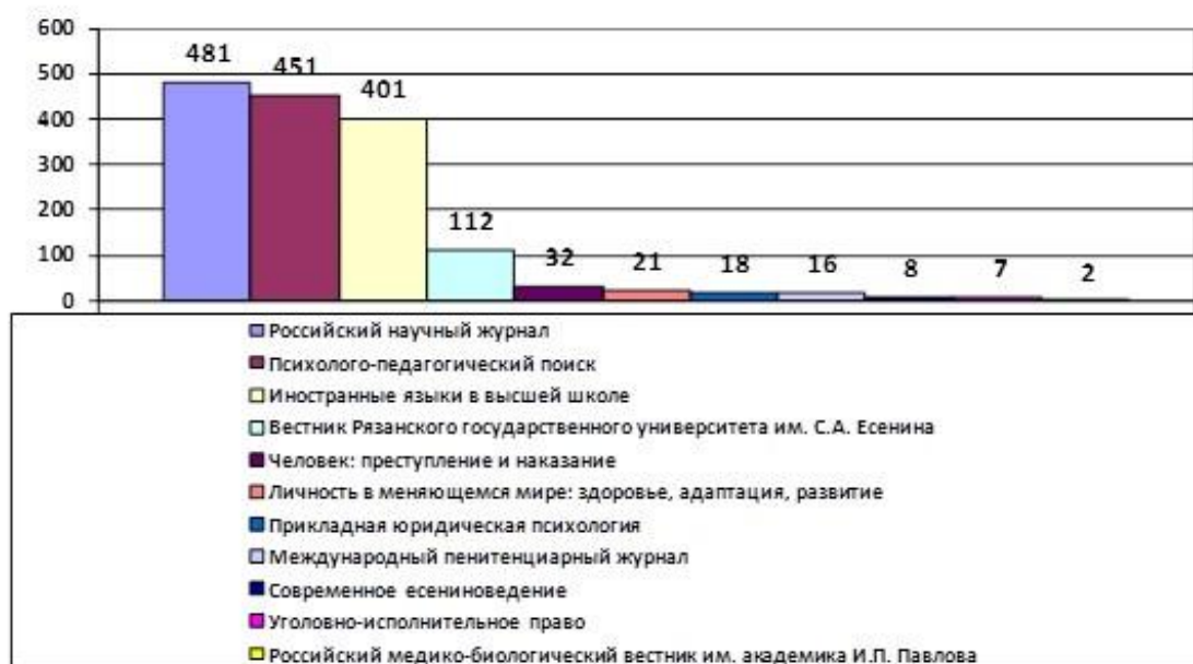
Рис. 4. Массив статей по педагогике в рязанских журналах, индексируемых в РИНЦ (2000–2018 гг.)