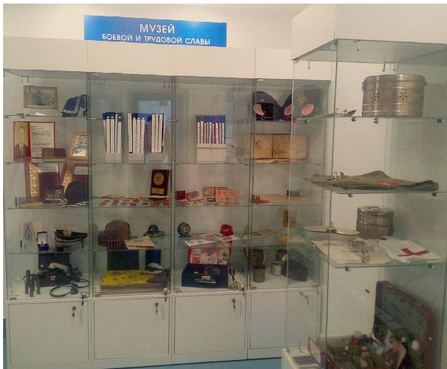
Рис. 1. Музей боевой и трудовой славы микрорайона Затон в библиотеке им. А. А. Фадеева

Уникальность музея заключается в его происхождении – все экспонаты музея принадлежат жителям микрорайона Затон, наследникам и представителям флотских династий. В библиотеке экспонаты находятся на хранении и экспонируются с разрешения владельцев. Оставаясь в частных коллекциях и семейных архивах, эти материалы и экспонаты были бы недоступны массам.