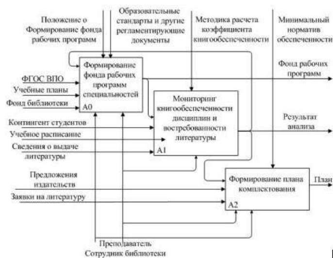
Рис. 3. Функциональная модель управления процессом формирования фонда библиотеки вуза

Система управления формированием библиотечных фондов отражена в разработанной функциональной модели автоматизированной поддержки управления комплектованием фонда библиотеки на основе интегрированной обработки информации в базе данных ИАС вуза (рис. 3). Модель выполнена в терминах методологии IDEF0 и отображает взаимосвязанные функции процесса управления комплектованием фонда библиотеки вуза. Границы модели охватывают взаимодействие ИАС, АБИС, мониторинг книгообеспеченности и системы управления комплектованием, принимающей решения о комплектовании фонда. Таким образом, мониторинг книгообеспеченности дисциплин и востребованности литературы – промежуточное звено между системой управления комплектованием и интегрированной автоматизированной информационной системой вуза [9].