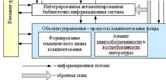
Рис. 1. Схема управления формированием фонда библиотеки вуза