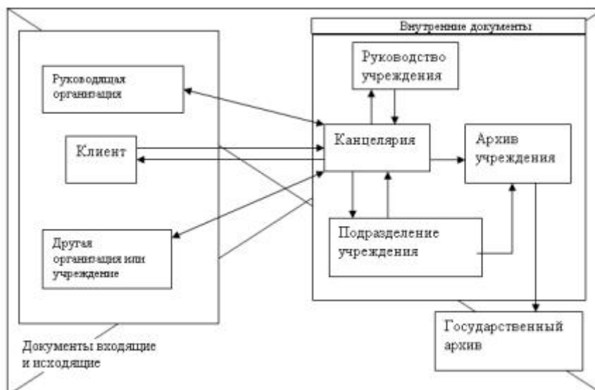
Рис. 2. Движение неопубликованных документов в учреждении

Движение неопубликованных документов в учреждении представлено в виде схемы (рис. 3).