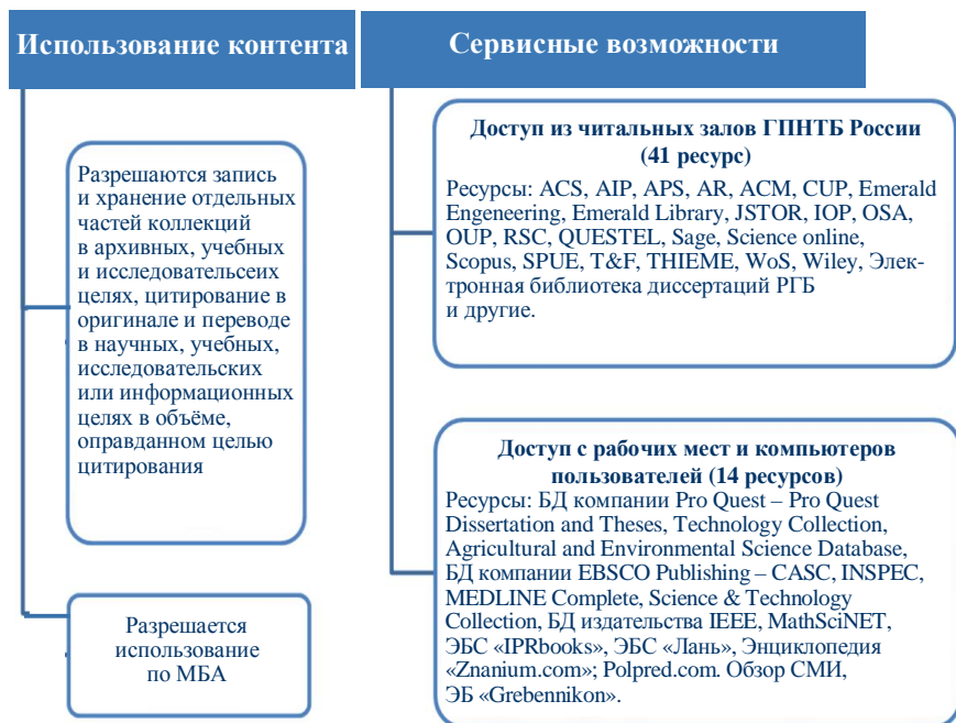
Рис. 2. Организация доступа к ресурсам по условиям лицензионных соглашений

Пользователям ГПНТБ России доступны свыше 3 млн полнотекстовых лицензионных документов в электронном виде. В их состав входят ресурсы собственной генерации, в первую очередь – созданная на основе традиционного библиотечного фонда электронная библиотека (ЭБ), включающая электронный архив. Ежегодно в ЭБ загружается около 2 500 документов, в настоящее время их более 20 тыс.