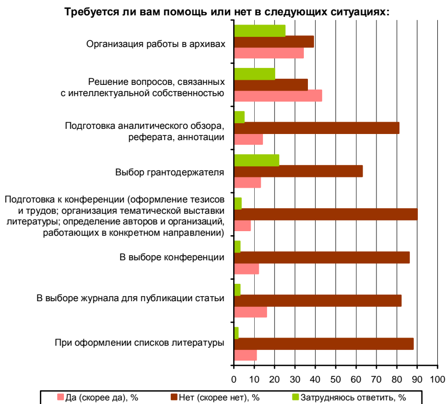
Рис. 3. Востребованность учёными ННЦ определённых информационных услуг, предоставляемых ГПНТБ СО РАН

В последние годы ГПНТБ СО РАН предоставляет и другие информационные услуги, такие как выбор журнала для публикации статьи, выбор конференции, подготовка к ней (оформление тезисов и трудов, организация тематической выставки литературы, выявление авторов и организаций, работающих в определённом направлении), выбор грантодержателя. Однако, согласно ответам респондентов, в помощи при выборе журнала для публикации статьи не нуждаются 82%, при выборе конференции – 87%, при подготовке к конференции – 90%, при выборе грантодержателя – 64%. И опять же мы видим достаточно небольшой круг читателей, нуждающихся в предложенных услугах (8–16%). Напрашивается вывод: читатели, возможно, не доверяют сотрудникам библиотеки выполнение перечисленных работ, полагая, что сами справятся лучше (рис. 3).