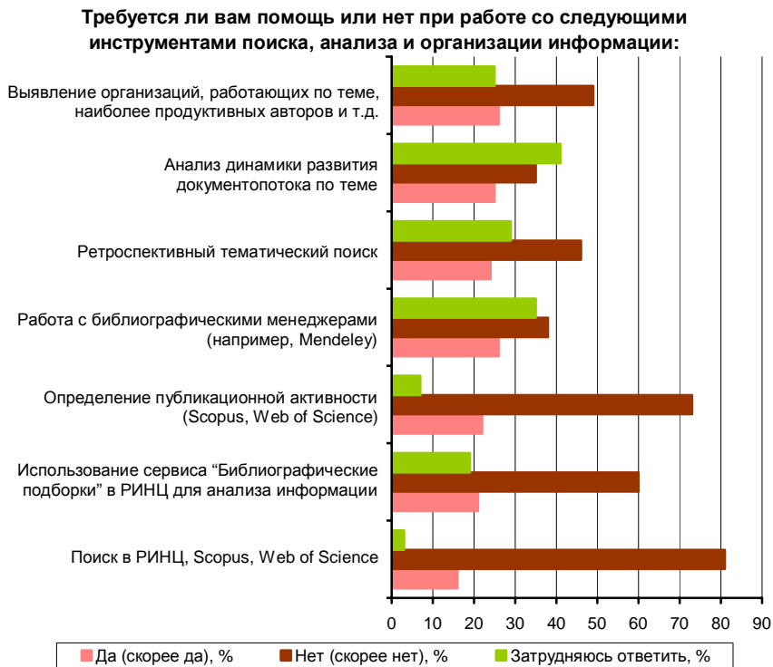
Рис. 2. Потребность в предоставлении ряда информационно-поисковых услуг учёным ННЦ СО РАН

При проведении анализа динамики развития документопотока по теме НИР (как правило, на начальном этапе работы) помощь требуется 24% респондентов, 41% затруднились ответить на этот вопрос (рис. 2).