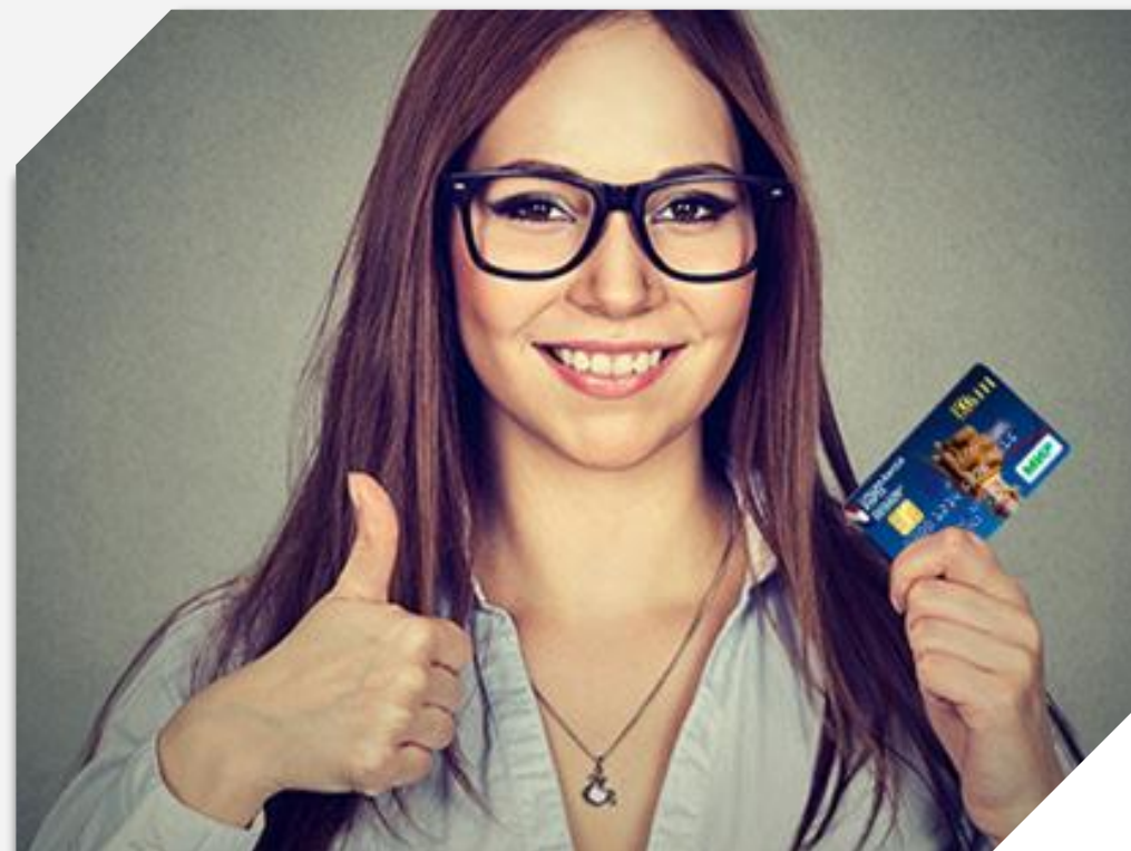
Использование банковских карт для онлайн-услуг